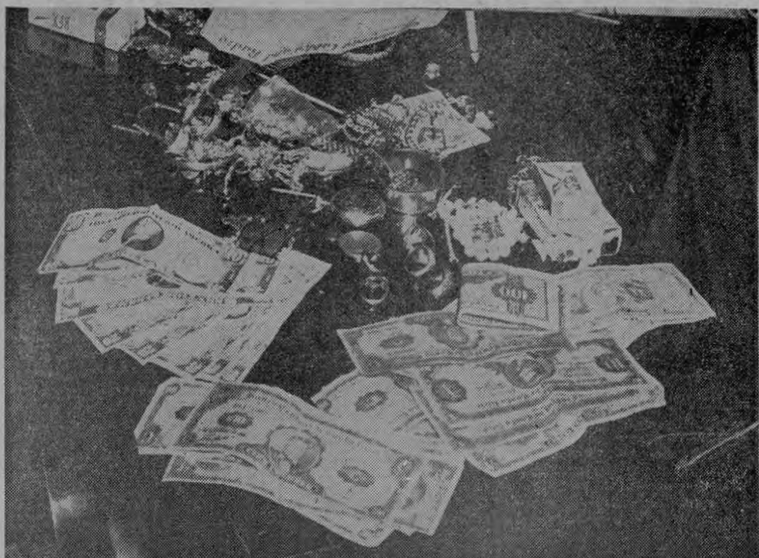
El botín: joyas, rubíes, esmeraldas, amatistas, perlas legítimas y no adulteradas por los cultivos en masa. Joyas y más joyas. Dólares y colones. Todo en un desorden magnético por valor de miles de colones.

Conferencia de Prensa ayer en Detectives. Objeto informar del esclarecimiento de un robo escalonado de joyas en la ciudad de San José. Presentes: el Director de Detectives Mayor Lacayo y el Sub Director Capitán Coto. Oficiales de investigación y periodistas. En una mesa de pata baja fajos de billetes en moneda estadounidense y nacional. Joyas y más joyas. Medallas de oro. Brazales de platino. Collares de perlas legítimas. Amatistas, zafiros, aguas marinas, brillantes.