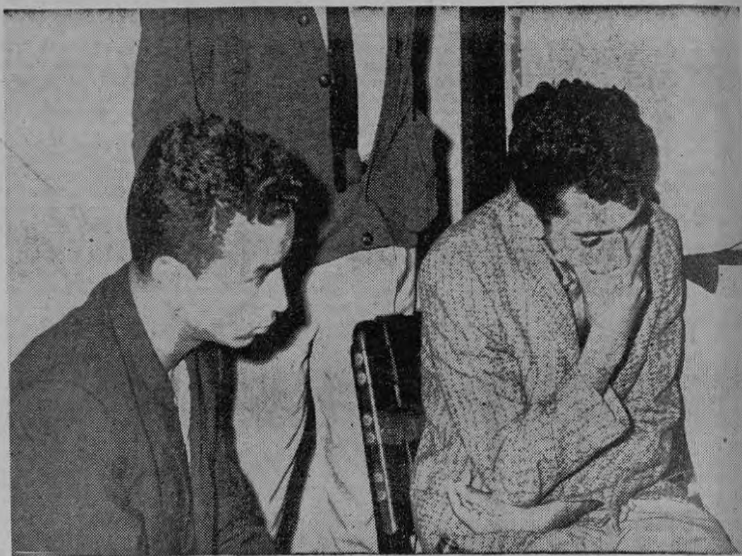
Los dos ladrones de joyas: el de izquierda venezolano, con los ojos llorosos y abatido ante sus planes derrumbados. A la derecha el colombiano, con un rictus de dolor en la boca y la cabeza baja. Los dos impotentes ante la ley que les cayó encima.

Los Detectives terminan el caso de los robos. Faltan joyas por recuperar. Los ladrones confiesan y se recuperan más de C400.000 en oro, platino y piedras preciosas. Todos satisfechos. Todos muy contentos. Menos los ladrones que tienen por delante un porvenir de cárcel.